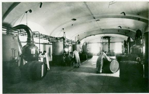
Salle des alambics sur le site de la Distillerie

En 1903, les Chartreux sont expulsés de France et vont implanter une nouvelle distillerie à Tarragone (Espagne) Ce n'est qu'après 1929 qu'ils reviennent à la distillerie de Fourvoirie. Le glissement de terrain du 15 novembre 1935 força les Chartreux à délocaliser la production, qui se trouve aujourd'hui à Voiron.