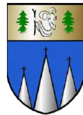
Saint Christophe Sur Guiers