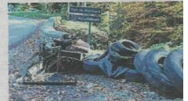
D'énormes pneus ont été retirés du torrent.

des habitants, des agriculteurs et des gens du territoire se sont regroupés en 1991, avec cette idée en tête, chose faite en 1995.