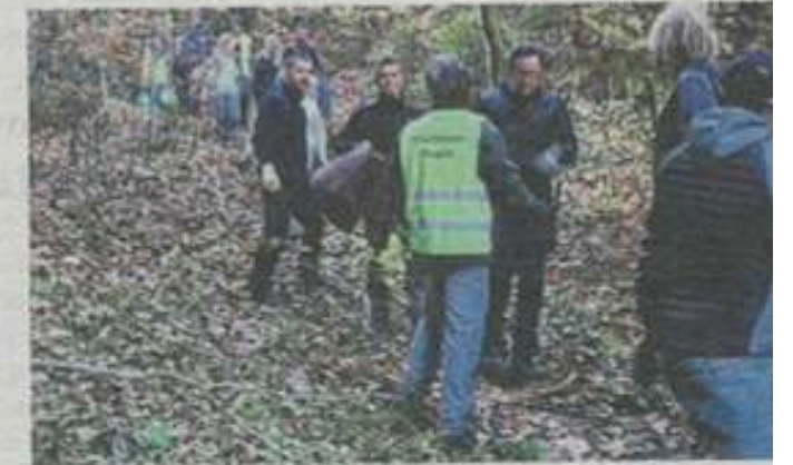
Les bénévoles ont travaillé à la chaîne.

En Nogues, secrétaire de l'association des Amis du Parc, a précisé que l'opération, a précisé, est sympa comme tout, est super attentif pour ne pas avoir de bobos. Car il faut que l'accès aux débris soit dans des lieux parfois difficiles d'accès. Mais on s'organise en haut des tas de déchets que l'on descend en faisant la chaîne. C'est parce que ça met en la force du collectif et beaucoup moins fatigant prendre un paquet, d'aller le ramasser. On essaie de ne pas aller chercher, on est là, on discute avec le voisin. Ça fonctionne, c'est difficile de faire comprendre que c'est plus efficace. La démonstration est faite une fois l'on a essayé. Quand on a beaucoup comme ça, c'est efficace. L'association des Amis du Parc est composée de bénévoles qui ont donné comme mission de favoriser la participation des habitants du territoire. Cette association est à l'origine de la création du parc, lorsque des élus,