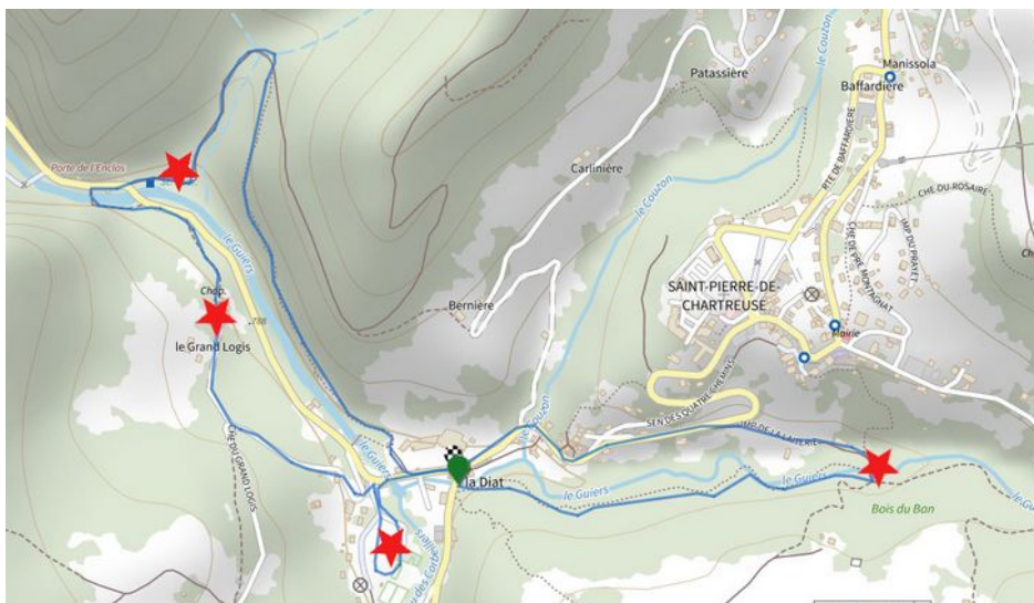
Le parcours de ces Retours aux Sources#2 avec les divers points d'arrêts

La balade a rassemblé 33 personnes : 25 participants inscrits, 2 élus de Saint-Pierre-de-Chartreuse, 4 intervenants, 1 agent technique du PNRC et 1 personne en charge de l'organisation.