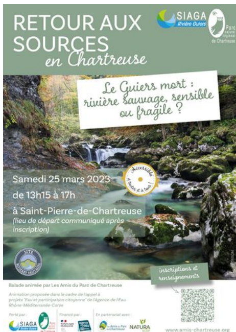
Le flyer de communication sur la balade#2 fait par le SIAGA