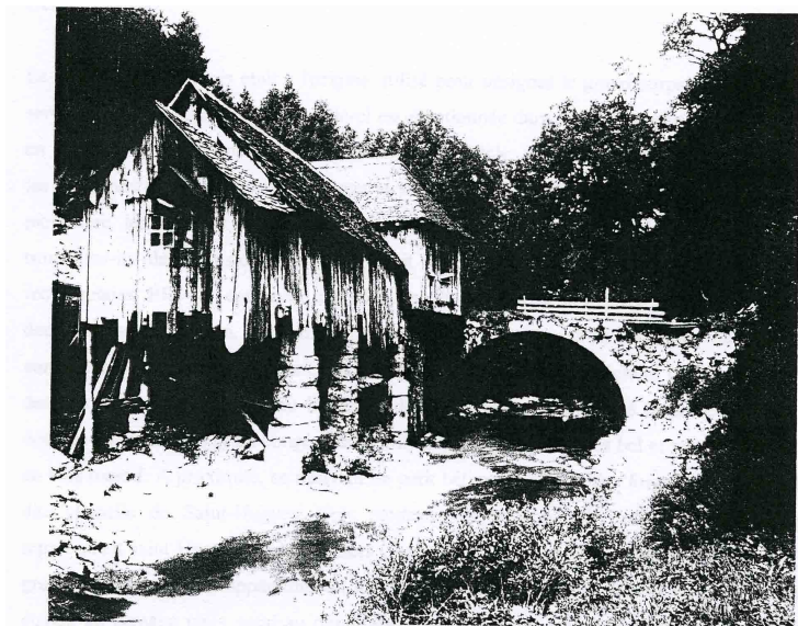
La scierie de la Diat et le pont de La Dame en 1902.

Inconnus : il y a dans la berge maçonnée rive gauche, des sorties voûtées : les sorties du canal de fuite ?